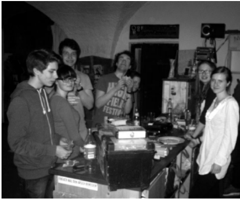
Arbeitseinsatz im Predigerkeller – die Zentrale der Ev. Jugend Erfurt